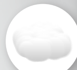
DOSSIER EN FIBRE